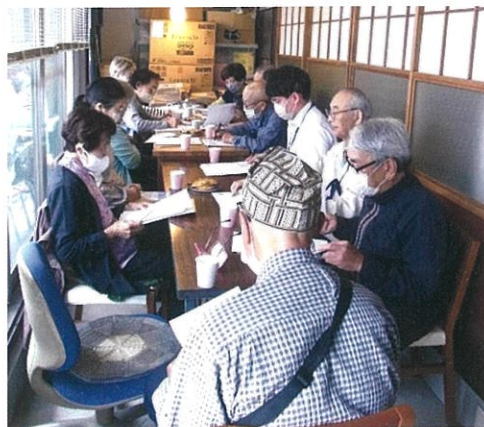
5月19日 古田交流プラザ コーディネーターの説明に意見を交わす

3月に講座が終了してからも、月1回のペースで13名から15名の方が交流プラザに集合して協議を重ね、令和5年10月からの本格的な活動開始に向けて準備を進めています。