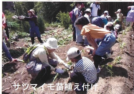
サツマイモ苗植え付け