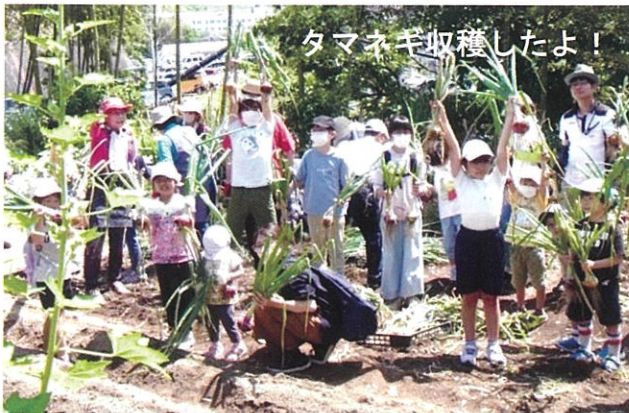
タマネギ収穫したよ!

4月2日(日)、古江上一丁目の《花園》で昨年子どもたちが植え付けたチューリップの花が美しく咲きました。♪咲いた 咲いた チューリップの花が…の歌詞がピッタリの雰囲気でした。チューリップの花の観賞後、2本ずつ摘み取りおみやげに。地面には、あちこちにタケノコが顔をのぞかせていました。友人同士や親子で協力して収穫しました。昨年よりも上手にタケノコを掘れたようです。